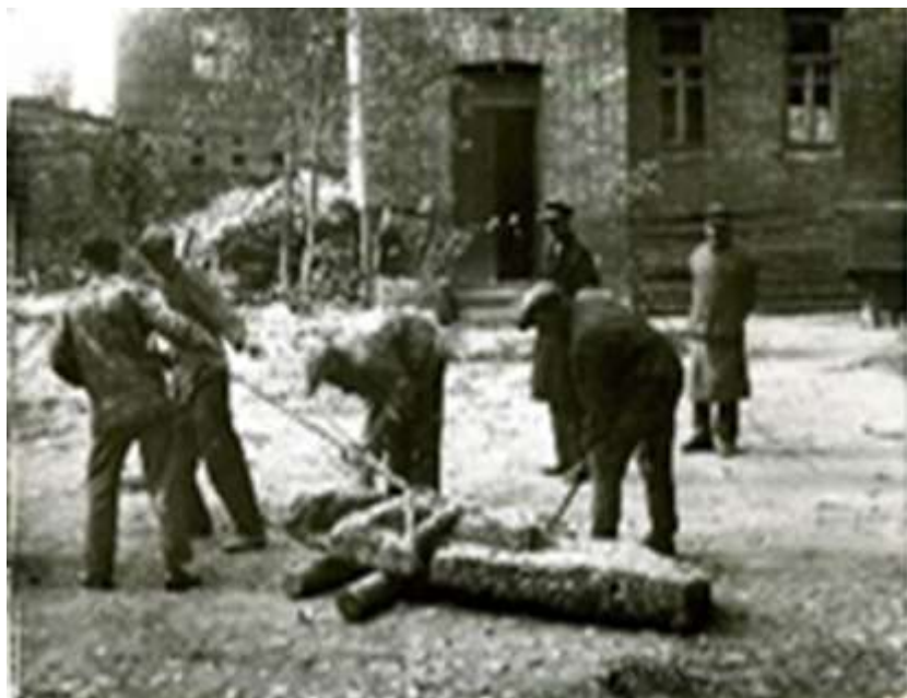
Рис. 2. Доставка статуй во двор музея в октябре 1937 г.

Большая часть каменных баб в собрании Мариупольского музея – 28 экземпляров – поступила в 1937 г., после слияния фондов Сталинского и Мариупольского музеев и экспедиции того же года по сбору экспонатов в Першотравневый район под руководством В.М. Евсеева. Сохранилось уникальное фото доставки статуй во двор музея в октябре этого же года [2]. (Рис. 2)