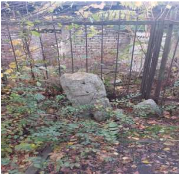
Рис. 4. Поврежденное половецкое изваяние. Ноябрь 2023 г.

В коллекции музея до СВО находилось 28 половецких статуй: 14 мужских и столько же женских. Некоторые статуи в коллекцию вошли уже поврежденными, у части были отбиты головы [2].