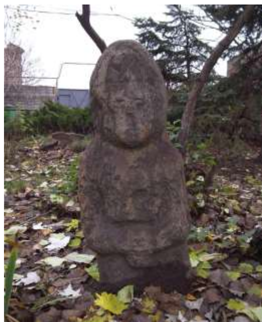
Рис. 3. Фигура печенежского воина (съемка 2010-х гг.)

К XII веку сложился иконографический канон: все статуи изображаются с сосудом для возлияния у живота. Стиль половецких изваяний можно охарактеризовать как этнографический реализм. Скульптура отображает детали одежды, головных уборов, украшений, оружия. Ноги и вообще нижняя часть тела у статуй специально укорочены. В настоящее время эти пропорции