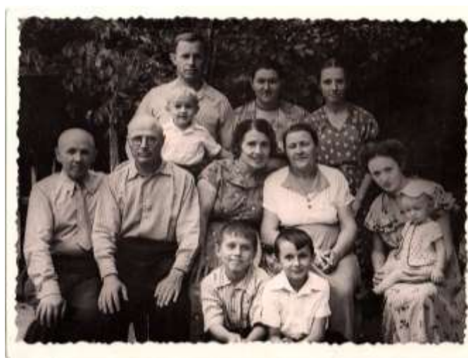
Большая семья Кухарук