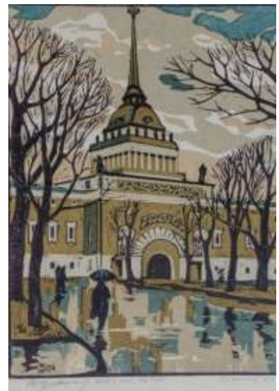
Рис. 5 Линогравюра неизвестного автора "Адмиралтейство"

Так же коллекция печатной графики музея пополнилась цветными линогравюрами неизвестных авторов, в количестве 5 штук, созданными советскими художниками-графиками в 1979 г.: «Адмиралтейство» (Рис.5), «Церковь Покрова на Нерли», «Каменец Подольский. Кушнирская башня», «Кострома. Ипатьевский монастырь», «Сергиевская Лавра». Эти работы уже не раз принимали участие в выставках и межмузейных проектах.