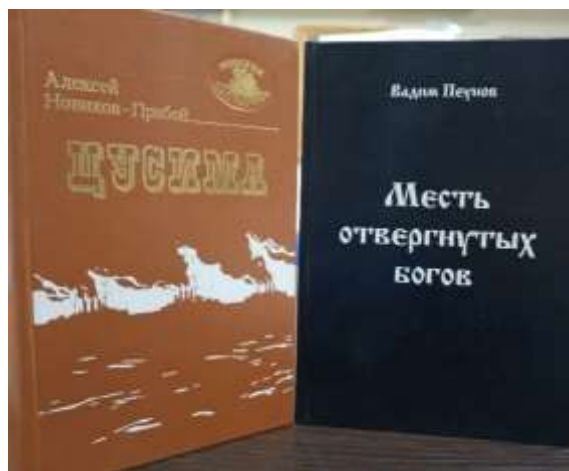
Рис. 3 Обложка романа «Месть отвергнутых богов»