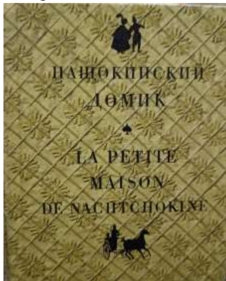
Рис. 1 Обложка книги «Нащокинский домик»

Еще больше укрепились дружба и общение с А.А. Жаровым после того, как Художественно-выставочный центр «Арт-Донбасс» в мае 2017 года изменил статус и стал Художественным музеем «Арт-Донбасс», который начал собирать свою коллекцию.