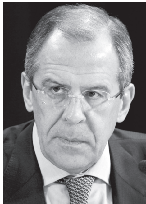
Об ЛНР и ДНР ничего не сказано в Минских соглашениях, о которых вы так много говорите.

Вопрос: На прошлой неделе Президент России В. В. Путин сказал о том, что Российская Федерация готова вернуть из Крыма бронетехнику и корабли украинской стороне. Президент также говорил о том, что после решения вопроса Донбасса наладятся отношения России и Украины. Насколько для России важно сохранение псевдогосударственных образований на Востоке Украины?