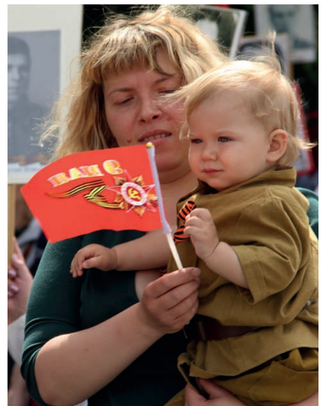
Наша победа ещё растёт

Мне нравятся наши военные парады. Я смотрю на лица солдат, многие из которых живут на передовой, и вижу в них спокойствие, уверенность, вижу человеческие чувства. Чепчики в воздух сейчас бросать не принято, но дорога устлана цветами, принесёнными донецкими девушками. Праздник отлично демонстрирует связь между вой-