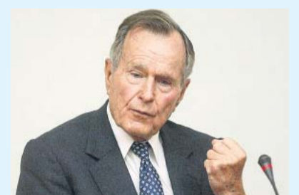
Интервью Буша-старшего, 1992 год