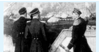
Победа у мыса Синоп Александр Самсонов