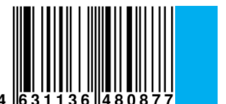
Телепрограмма 10 - 16 декабря