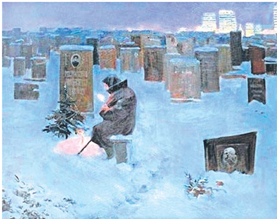
Сергей Андрияка. Новогодняя ночь

Посмотрите на эту картину. Я даже представить не мог такого одиночества! Пронзительное одиночество и при этом... какая фантастическая любовь! И как плохо остаться вот так, совсем одному. Все, кто знал твой голос, твои привычки, твои шутки. Все, кто знал, чему ты рад, а что тебя огорчает. Все уже ушли. И теперь ты один.