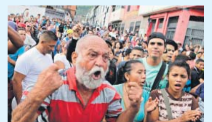
Есть ли у демократии цели?