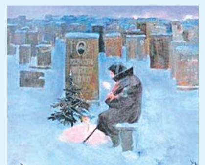
Новогодняя ночь Сергей Лебедев