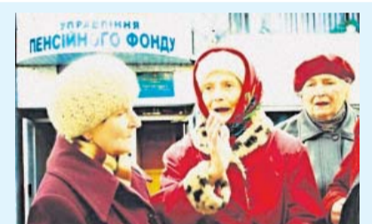
Кто заставит Киев платить трудовые пенсии?