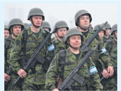
Ёжики в тумане Игорь Карамазов